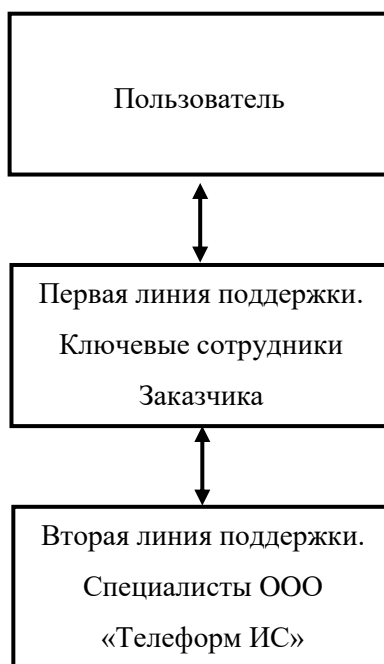
Рисунок 1. Схема организации технической поддержки пользователей

Порядок взаимодействия линий поддержки приведен ниже (Рисунок 1).